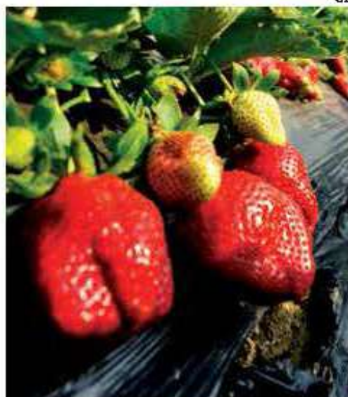
Flores parcialmente polinizadas geram morangos com desenvolvimento incompleto (à esquerda). Morangos só ficam com boa formação graças às flores bem polinizadas (à direita)

O uso da abelha jataí junto a morangueiros de ambientes protegidos, por exemplo, diminuiu a má-formação dos frutos em 70%. Os tomates cultivados em ambientes protegidos também dependem das abelhas para ser fertilizados.