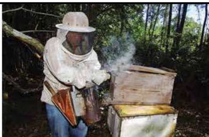
Forma mais conhecida de produção de mel na apicultura brasileira

Em uma colmeia racional padrão, as operárias ficam na melgueira e no ninho, enquanto as larvas, os zangões e a rainha permanecem apenas no ninho, onde se localiza a entrada da colmeia (o alvado).