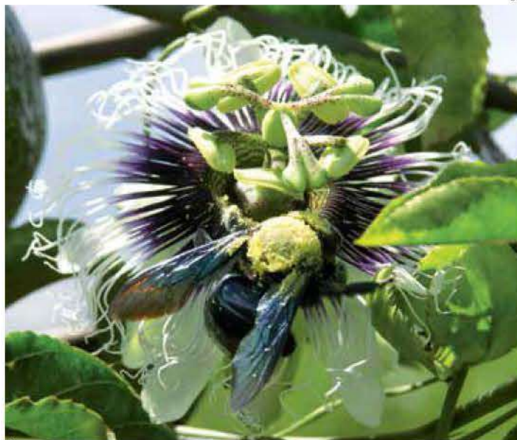
A abelha mamangava ( Xylacopa ) visitando flor de maracujá-amarelo