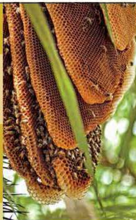
Favos de Apis mellifera em ambiente natural

Geleia Real - o que é: secreção produzida pelas abelhas jovens Para as abelhas: alimento exclusivo das larvas que se tornarão rainhas Para os homens: substância nutritiva com propriedades medicinais